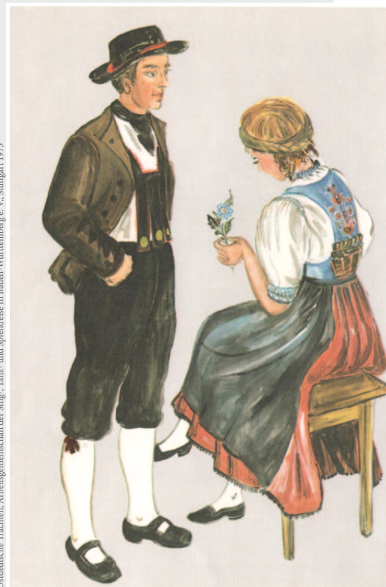
Ostdeutsche Trachten, Arbeitsgemeinschaft der Sing-, Tanz- und Spielkreise in Baden-Württemberg e. V., Stuttgart 1975

Egerer Tracht aus dem ehemaligen Sudetenland: Die Frauentracht wurde in feinsten Handarbeit bestickt, insbesondere auf dem Rücken und auf den sogenannten „Muadln“ am Ärmelabschluss der Bluse. Zur Egerländer Herrentracht gehörte das „Geschirr“, schön verzierte breite Hosenträger aus Leder.